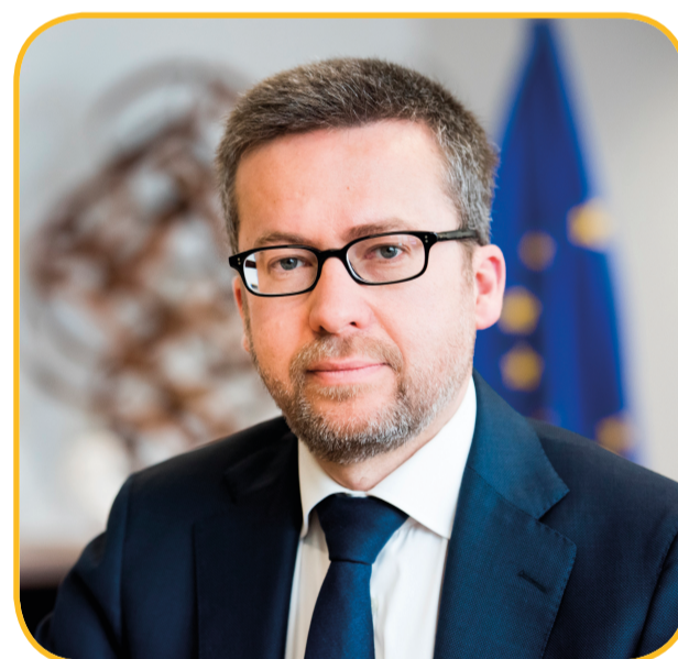
Carlos Moedas Europees Commissaris voor onderzoek, wetenschap en innovatie